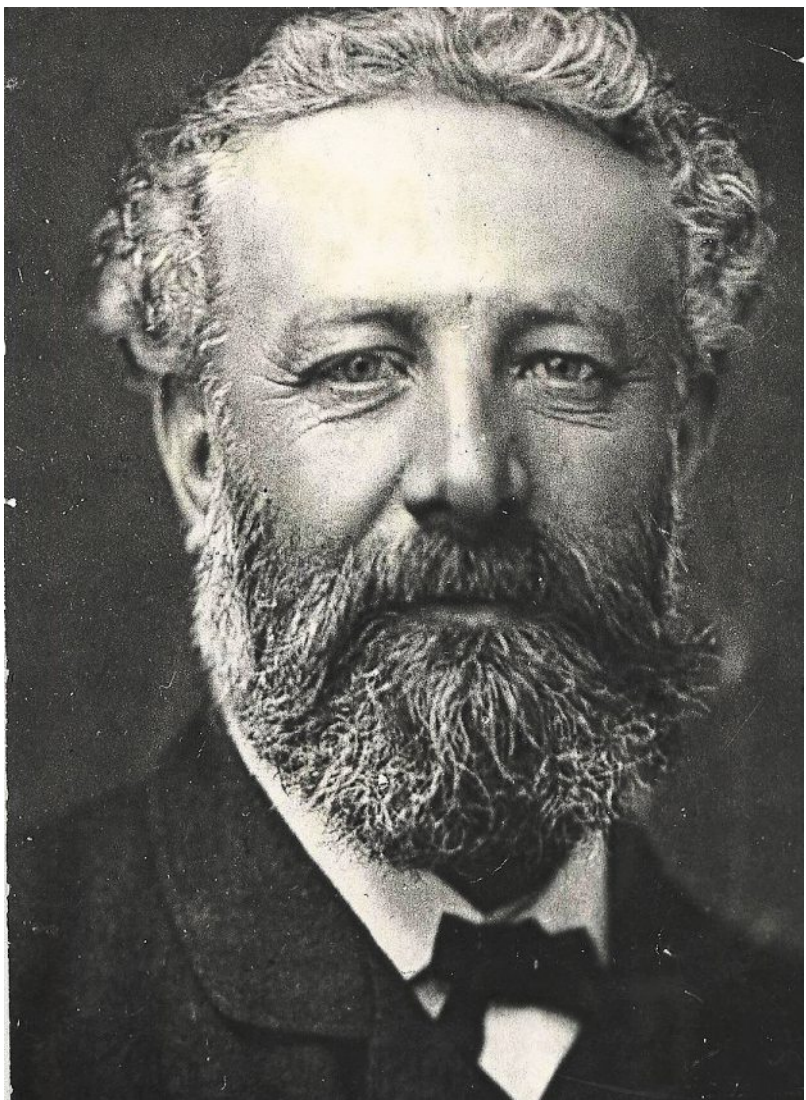
Jules Verne, l'un des plus grands écrivains français, est né à Nantes en 1828. Il est mort à Amiens en 1905.

Quel virus avait piqué le grand écrivain populaire ? Celui du voyage ? Plutôt celui de la science, qui lui permettait de mêler vulgarisation et impressionnante imagination. Certes, il se dit que Jules Verne a tenté, très jeune, d'embarquer depuis Paimboeuf, sur les bords de Loire entre Nantes et Saint-Nazaire... Il a très vite été rattrapé par son père.