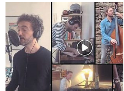
Renan Luce et des membres de son groupe.

De son côté, Renan Luce reprend Du bout des lèvres , de Barbara, avec son groupe, chaque membre depuis chez lui, en mode écran mosaïque. Comme un reflet de la diversité de ce « Printemps imaginaire ».