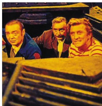
« Vingt mille lieues sous les mers », film réalisé par Richard Fleischer, sorti en 1954.

20 000 lieues sous les mers est l'une des grandes épopées de la série Voyages extraordinaires , qui a beaucoup inspiré, non seulement le cinéma et la littérature, mais aussi la science et l'exploration.