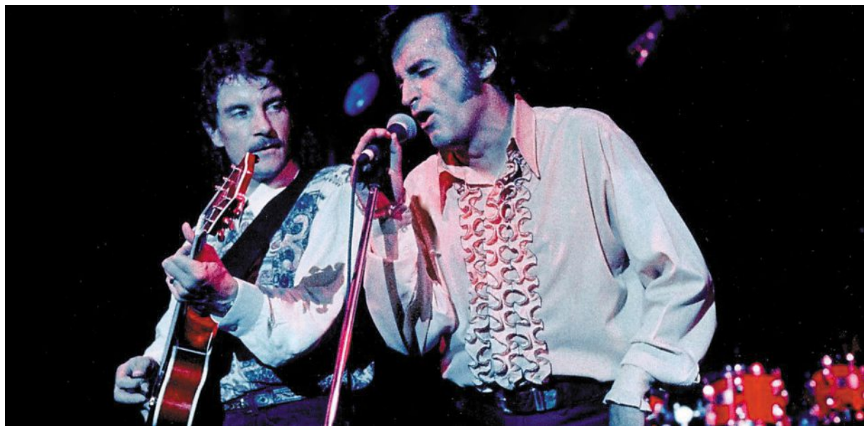
Il y a presque trente ans, Francis Cabrel et Dick Rivers étaient sur scène pour chanter des standards du rock'n'roll.