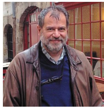
Martin Winckler, de son vrai nom Marc Zaffran.